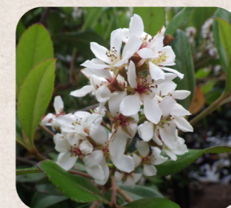
⑤ マルバシャリンバイ