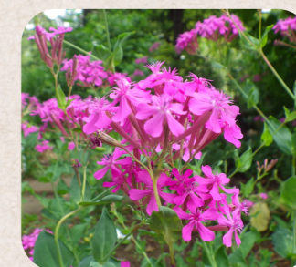
ムシトリナデシコ