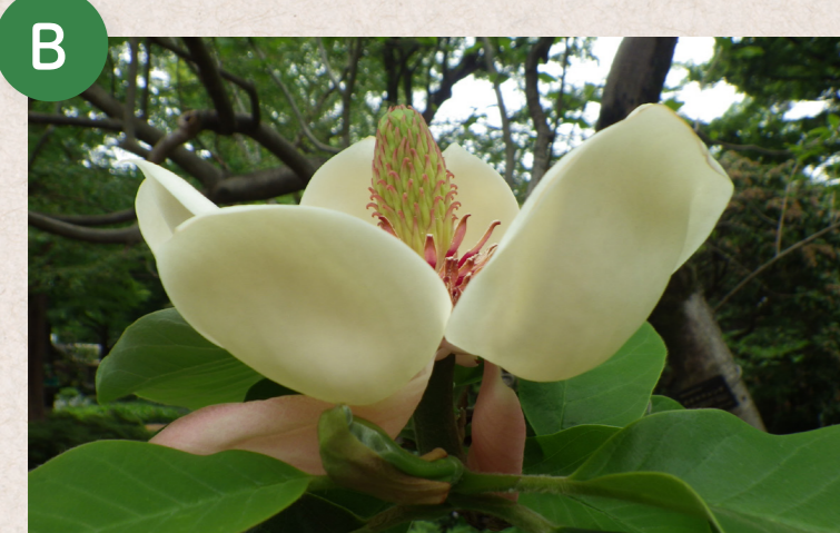
ウケザキオオヤマレンゲ (受咲大山蓮華)

日本に自生する花木では最大級の葉と花をつけます。園のホオノキは樹齢300年近い巨木で、幹周5mを超える太さと樹形にもご注目ください。