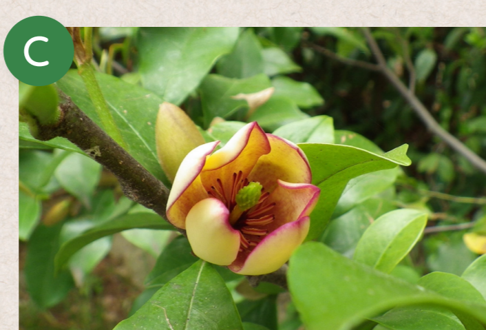
カラタネオガタマ (唐種招霊)

低木でうつむき加減に花をつけるオオヤマレンゲと高木のホオノキの雑種といわれています。樹高はオオヤマレンゲ、葉の大きさと上向きに咲く花はホオノキ譲りでしょうか。