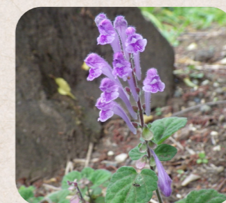
コバノタツナミソウ